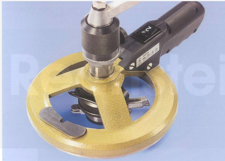
MIRA BB-86 Büchsenbundgerät

Neue Motoren-Baureihen von CATERPILLAR, VOLVO, SCANIA und RENAULT haben bis zu 205 mm tiefer liegende Büchsenbundsitze. Die neu entwickelte Spindelverlängerung mit graviertem Millimeter-Skala ermöglicht die problemlose Bearbeitung mit dem MIRA BB-86 Büchsenbundgerät. Die Bearbeitungstiefe des Drehstahls ist stufenlos verstellbar. Von VOLVO und SCANIA empfohlen (OEM Werkstatthandbuch)