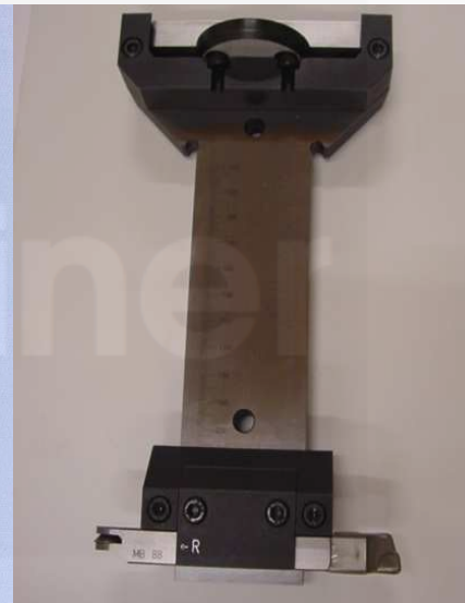
Verlängerung CPR Art. Nr. 52-800

Spindelverlängerung (ohne MIRA BB-86 Gerät) in praktischer Kunststoffbox