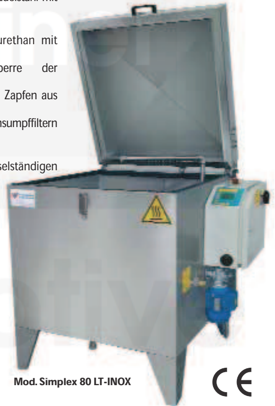
Mod. Simplex 80 LT-INOX

* Absaugung und Platten unter dem Korb sind obligatorisch