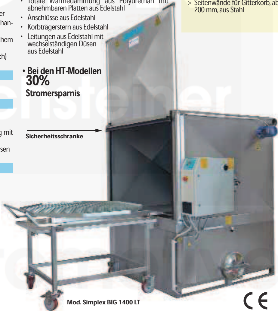
Mod. Simplex BIG 1400 LT